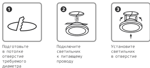
Рис. 1. Порядок монтажа

Монтаж продукции Gauss® должен быть произведен так, чтобы обеспечить надежную фиксацию и удобный доступ для обслуживания (рис. 1). Подключение светодиодных светильников к сети электропитания потребителя производится с помощью клеммной колодки согласно схеме (рис. 2).